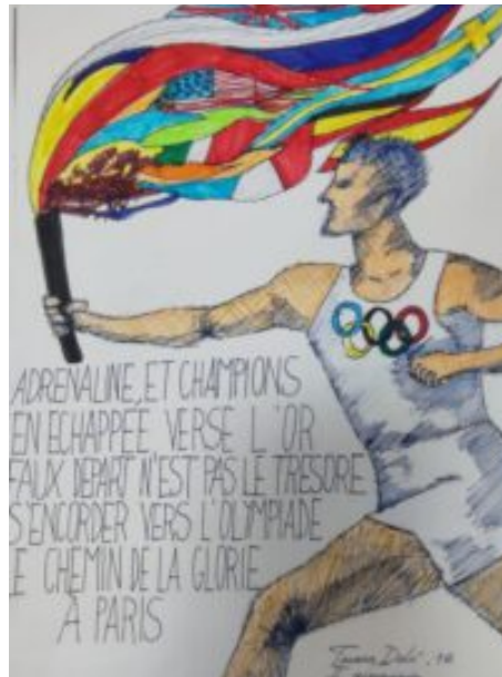
natjecanje "Dis-moi dix mots sur le podium"