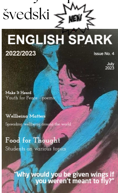
digitalni časopis na engleskom jeziku